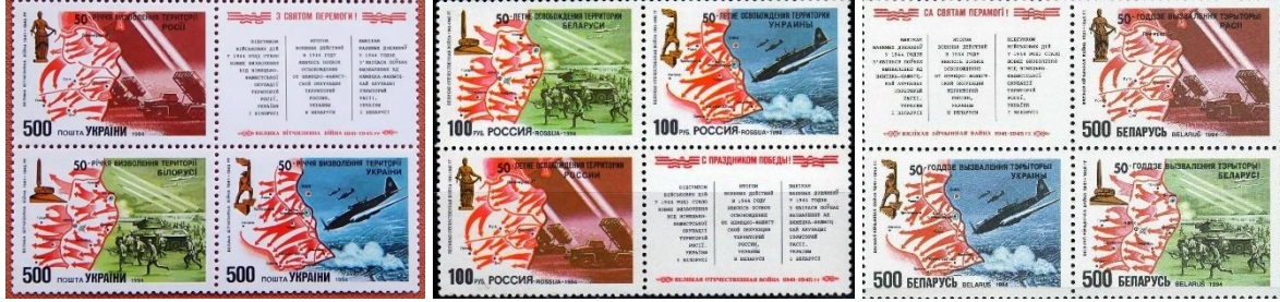
1994 yılında Ukrayna, Rusya ve Beyaz Rusya (Belarus) ile ortak olarak çıkarılan pullar

Ukrayna Posta Kurumu Ukrposhta, Rusya, Ukrayna ve Beyaz Rusya topraklarının Nazi işgalinden kurtarılmasının 50. yıldönümü nedeniyle 1994 yılında Ukrayna, Rusya ve Beyaz Rusya (Belarus) ile ortak olarak çıkarılan pul ile yine Rusya, Ukrayna ve Beyaz Rusya arasında 2013 yılında vaftiz töreninin 1025. yılı anısına ortak olarak çıkarılan bloğun dolaşımından çekildiğini ve imha edildiğini duyurdu.